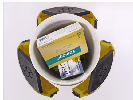
Be- und Entladung der Hülse erfolgen vollautomatisch